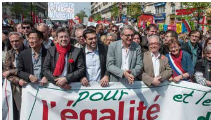
Jean-Luc Mélenchon, Alexis Tsipras et Pierre Laurent lors de la manifestation contre l'austérité du 12 avril 2014 qui a rassemblé plus de 100 000 personnes à Paris.

11 : c'est le nombre de plans d'austérité subis par la Grèce depuis 2010.