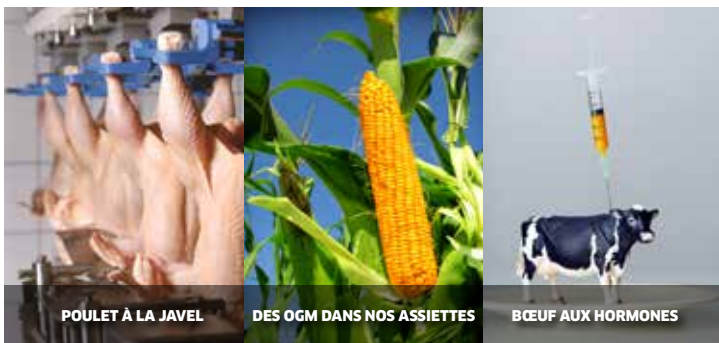
POULET À LA JAVEL